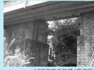
▲100年前の鉄橋(長津田)

全長42.6km、八王子や信州で生産された生糸を横浜へ輸送することを目的として開通されました。