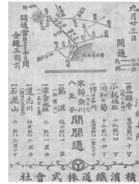
▲明治41年開通当時の雑誌に掲載された横浜鉄道開通の広告 ※1