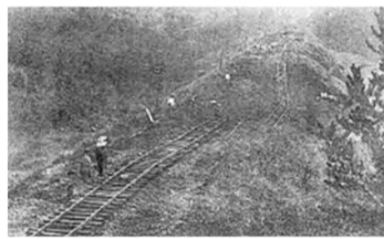
▲震災で至んだ線路(長津田～原町田間) <「鉄道調査書 大正12年」より> ※2

※1、※2はどちらも中央図書館所蔵 緑図書館の巡回資料展(右ページ参照)で、現物が展示されます